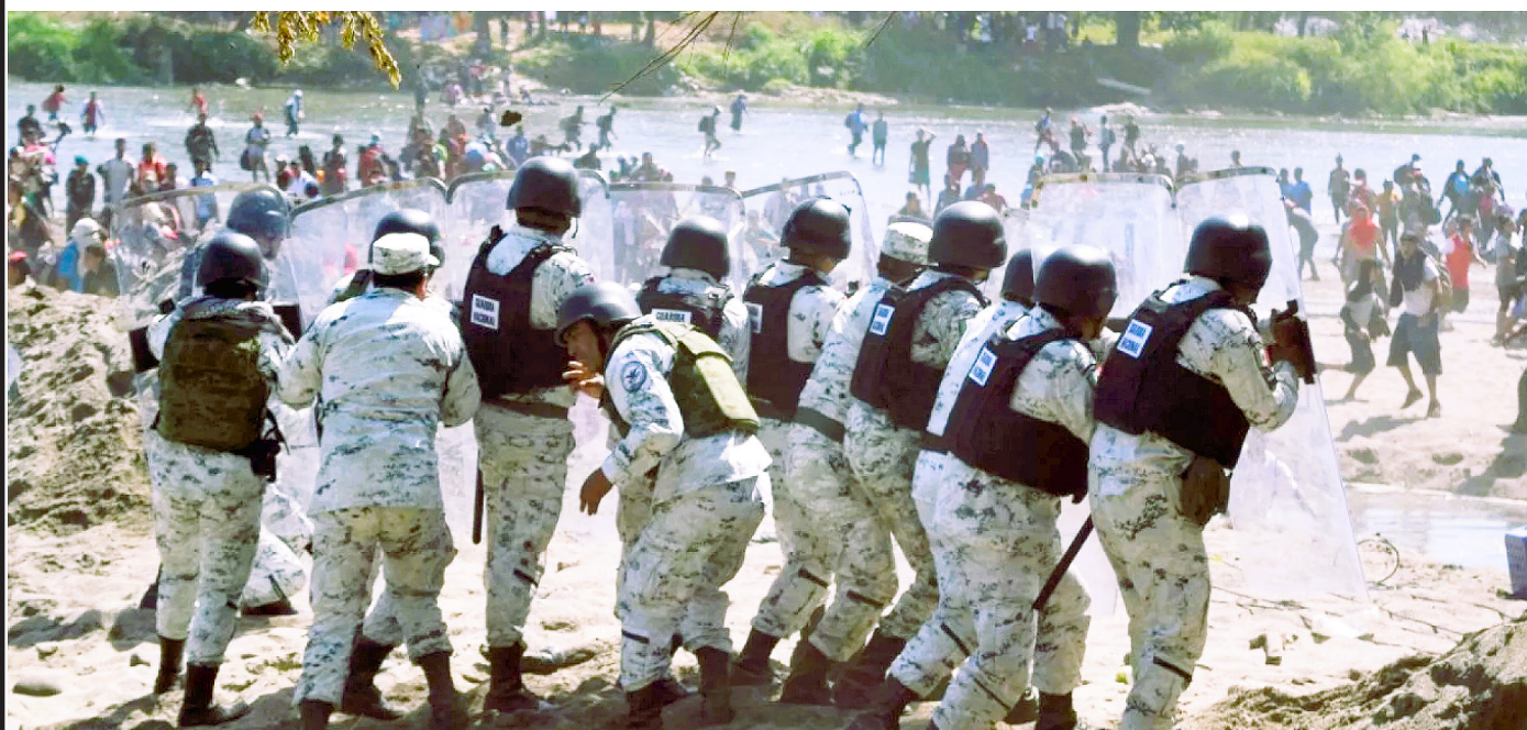
Guardia Nacional enfrentando a migrantes en la frontera con Guatemala

Desde la captura de los hijos del Chapo Guzmán y la familia de Ismael "El Mayo Zambada", Estados Unidos convirtió al hermano de este último en testigo protegido, quien dio información sobre el cártel, siendo liberado como intercambio y ahora se pasea con su familia en las calles de Chicago como hombre de negocios, ya que esta familia ha invertido en negocios lícitos para lavar el dinero habido a través de la droga.