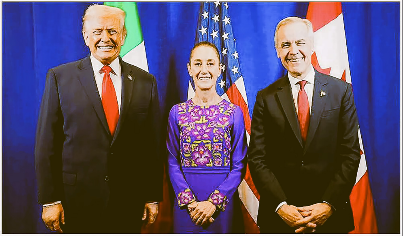
Los presidentes Donald Trump, Claudia Sheinbaum y Mark Carney se reunieron en Washington tras el sorteo del Mundial de Fútbol 2026, del que los tres países son anfitriones.

En enero de 2023, la sierra de Sinaloa fue escenario de un operativo conjunto en la “cooperación anti-narcóticos” entre México y los Estados Unidos, apoyados por helicópteros artillados, cercando el poblado de Jesús María con el objetivo de capturar a Ovidio Guzmán López, hijo de Joaquín “El Chapo” Guzmán y líder de “Los Chapitos”, fracción del Cártel de Sinaloa, acusado de traficar masivamente fentanilo al vecino país del norte. Esta operación fue liderada por la Agencia Central de Inteligencia (CIA) de los Estados Unidos.