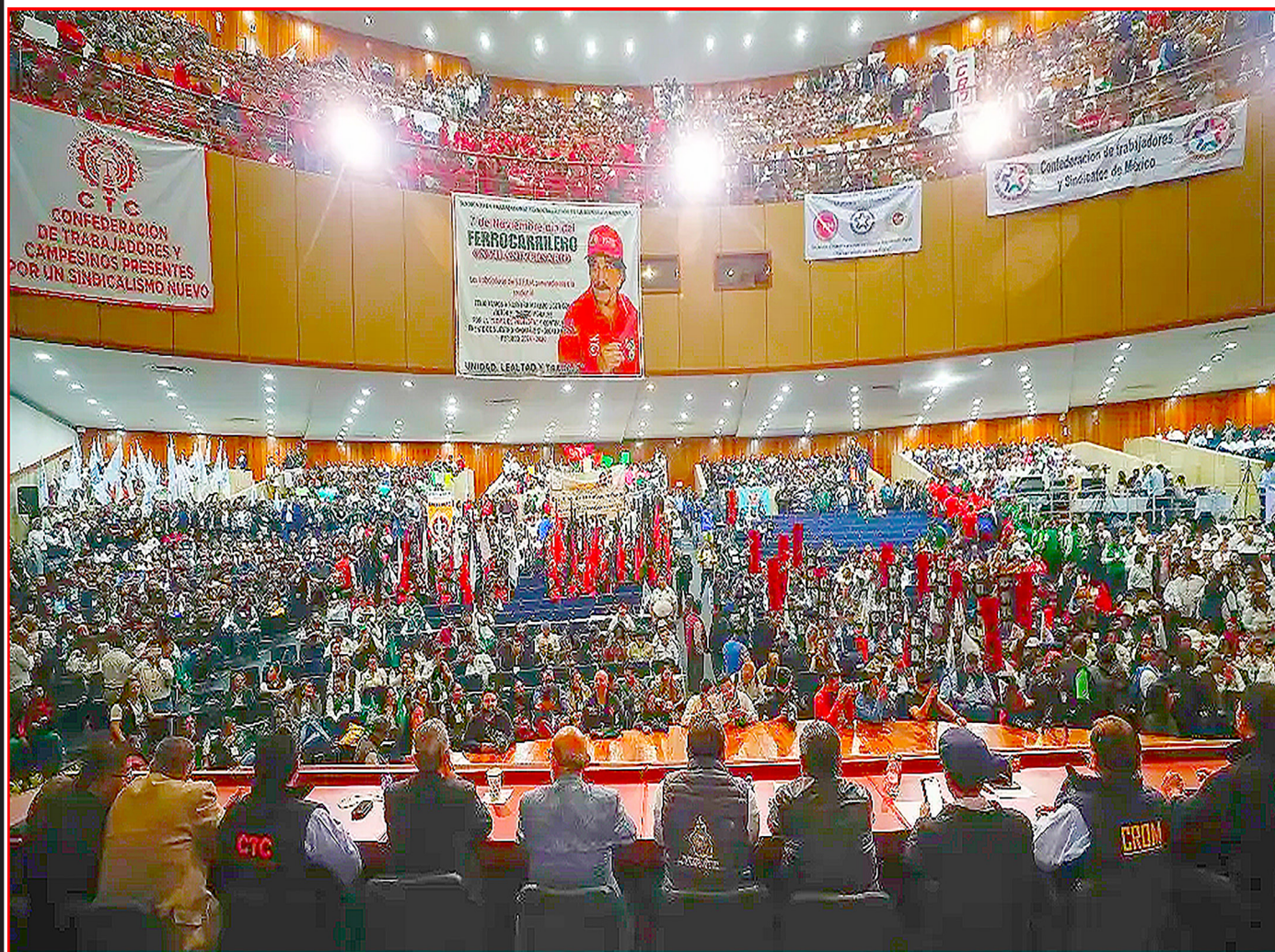
Cúpulas sindicales y Centrales Obreras cerrando filas con el oficialismo de CSP

Tren Maya, que no es solo un tren de pasajeros, sino cuenta con varias vías de carga para facilitar el saqueo de nuestros recursos naturales por vía férrea.